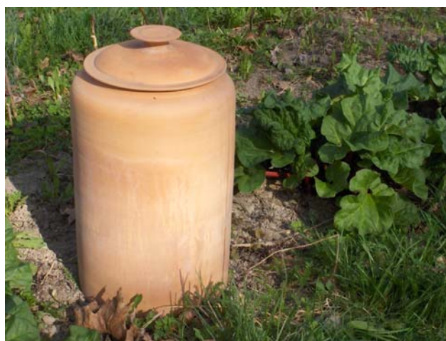
Forcing pot. Traditionellt engelskt hjälpmedel för drivning av rabarber

Ett stort tack till er odlare för att vi får ta del av era erfarenheter och att ni så tålmodigt fortsätter odla denna fantastiska gröda.