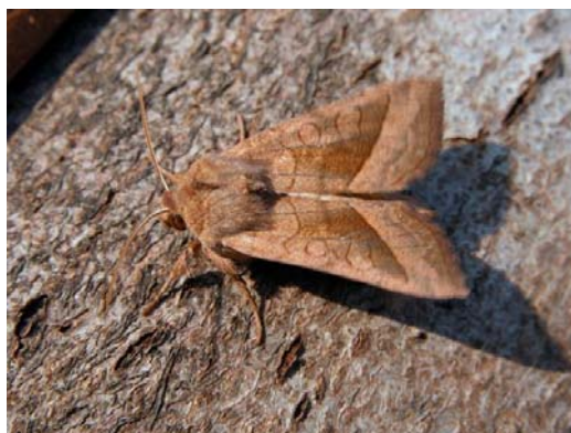
Potatisstamfly ( Hydraecia micacea ) förekommer allmänt från Sk till To. Vingbredd 33-43 mm. Larven lever i stjälk och rötter på diverse örter, förpuppling i en kokong i marken

Den lilla larven som gör gångar i stjälkarna kan vara Potatisstamflyet.